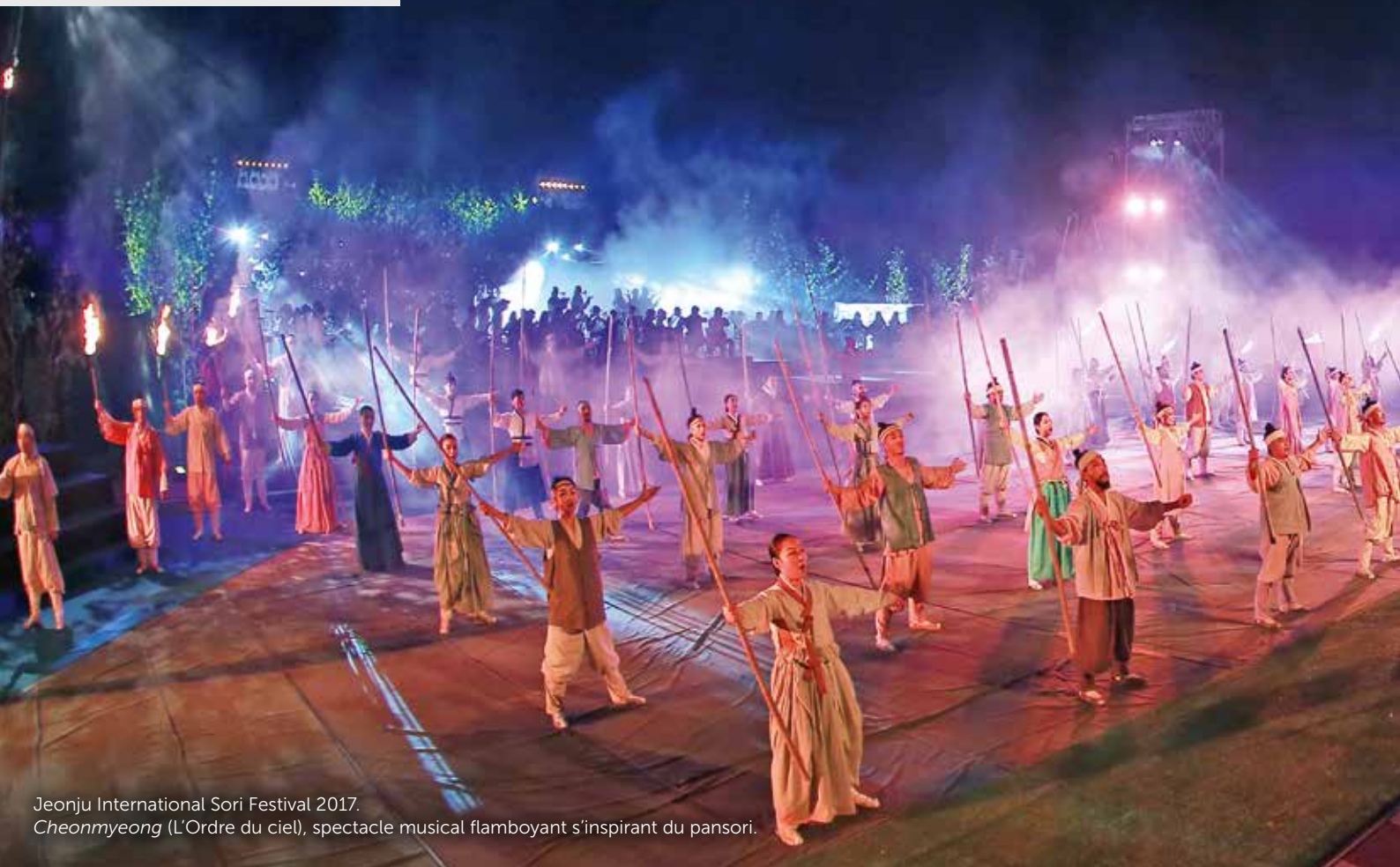
Jeonju International Sori Festival 2017. Cheonmyeong (L'Ordre du ciel), spectacle musical flamboyant s'inspirant du pansori.