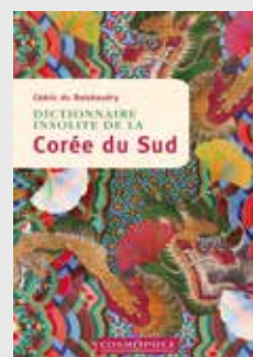
DICTIONNAIRE INSOLITE DE LA CORÉE DU SUD de Cédric DU BOISBAUDRY

La Corée du Sud déconcerte assurément. Dans ce pays à la croissance exponentielle, tout va vite, dans un tourbillon de lumières et de bruits. On en connaît la K-pop, qui déferle sur la jeune génération. Mais sait-on que, lors des épreuves orales du baccalauréat, les avions ont interdiction de voler, que l'on peut traverser une ville de long en large sans perdre de vue une église et qu'au Pays du Matin clair les ventilateurs sont associés à un danger de mort ? Ici, la division du pays semble n'être qu'un lointain souvenir, que seules les bases américaines et la DMZ rappellent. Conjugant de manière étonnante modernité et tradition, la Corée du Sud ne peut être... qu'insolite.