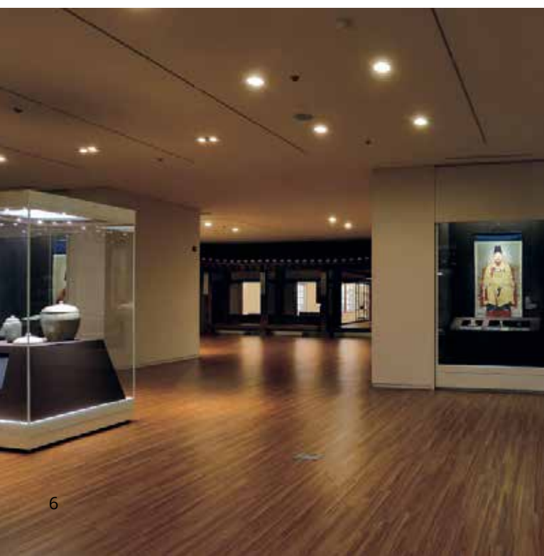
▼ Une salle du musée.