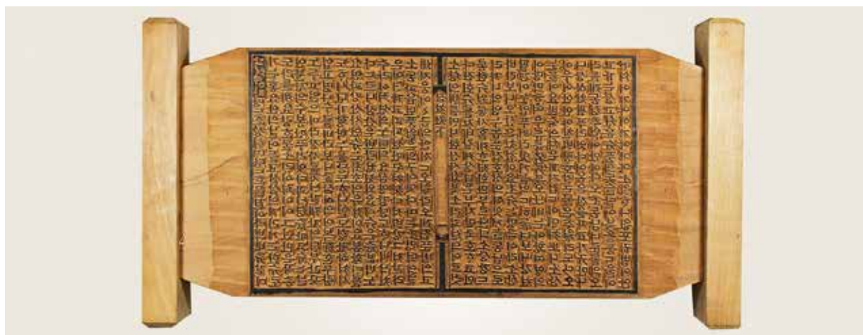
Une table de xylographie reconstituée racontant L'Histoire de Shimcheong . Il reste aujourd'hui très peu de planches témoignant du rôle important de Jeonju dans le rayonnement des récits populaires.

La conscience du peuple forgée à travers cette culture est sans doute un des éléments qui expliquent l’insurrection des paysans de 1894, déclenchée à Jeonju et dans ses environs et dirigée contre les fonctionnaires corrompus et les forces étrangères de plus en plus envahissantes. La romancière Choe Myeong-hui définissait l’esprit de Jeonju comme le « cœur d’une fleur », une sorte de détermination qui permet à une fleur de s’ouvrir en dépit d’un environnement défavorable.