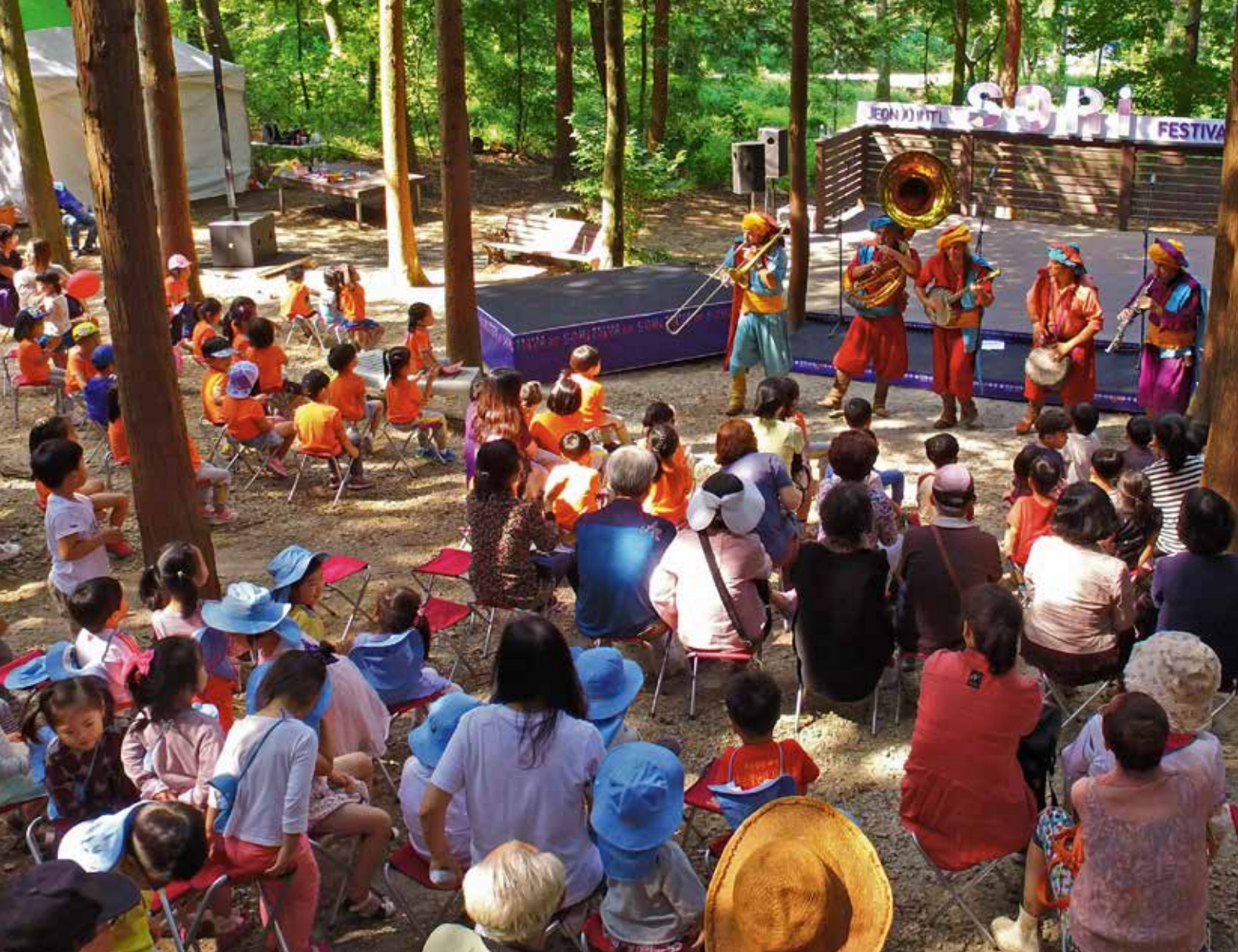
Jeonju International Sori Festival 2017. Concert en pleine nature du groupe français La Tit' Fanfare.

mêlent partitions anciennes et nouvelles, l'idée étant que la musique coréenne est Une, qu'elle soit traditionnelle ou contemporaine, et qu'elle peut toucher le cœur de tous les hommes, quelle que soit leur culture d'origine. C'est aussi dans cet esprit que de nombreux partenariats ont été effectués avec des groupes venus du monde entier, et l'on rejoint ici la question de la diffusion, qui est liée à l'esprit d'échange et de découverte.