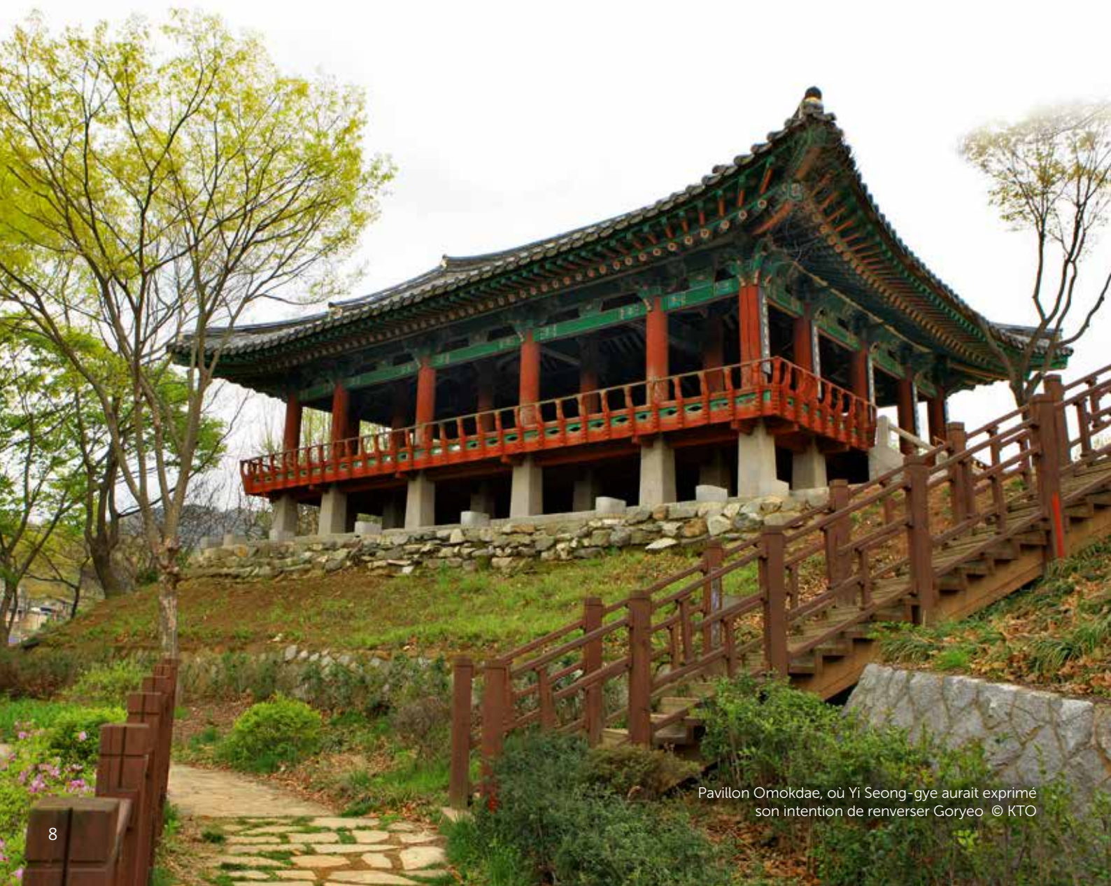
Pavillon Omokdae, où Yi Seong-gye aurait exprimé son intention de renverser Goryeo

Où trouverai-je des héros Pour garder les quatre horizons 1 ?