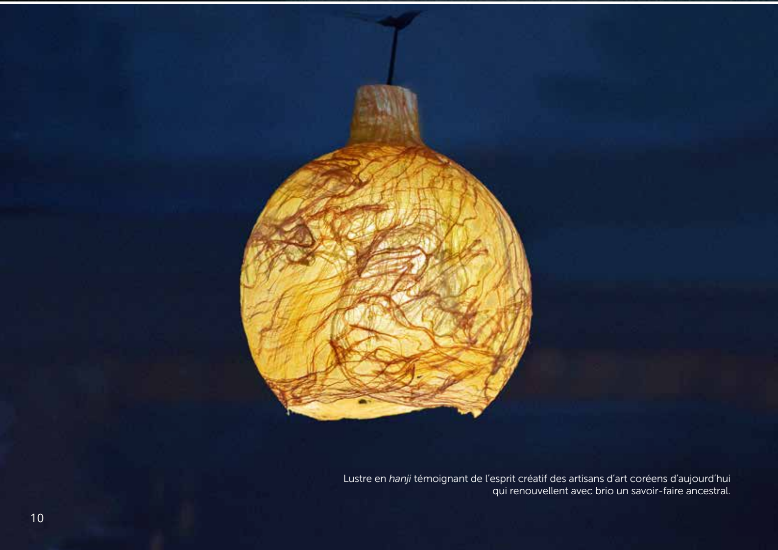
Lustre en hanji témoignant de l'esprit créatif des artisans d'art coréens d'aujourd'hui qui renouvellent avec brio un savoir-faire ancestral.