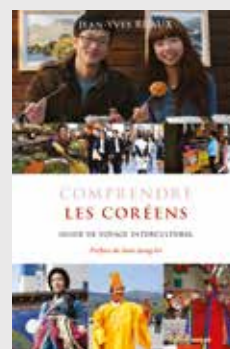
COMPRENDRE LES CORÉENS de Jean-Yves RUAUX

Comprendre la Corée ? C'est s'attaquer à un puzzle aux pièces vagabondes : Sud, Nord, 38 e parallèle, Pyongyang, Séoul, zone démilitarisée, Kim Il-sung, Park Chung-hee, bouddhisme, pentecôtisme, catholicisme rebelle... Le pays a été amputé, unifié puis redécoupé par les invasions. Comprendre les Coréens, c'est essayer de savoir pourquoi la dynastie des Kim du Nord revendique l'héritage magique de Tangun. Comprendre les Coréens, c'est détailler les composantes de leur mélancolie créative, de leur nationalisme voyageur. C'est appréhender leur appétit vorace pour les religions. C'est observer un pays extravagant qui préfère les chamanes aux analystes pour accompagner sa prodigieuse fuite dans la modernité. Avec un maître-mot : Ppalli, ppalli . Vite, vite !