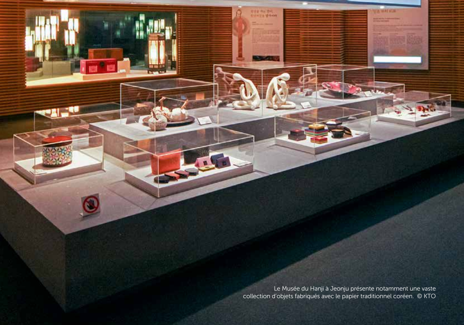
Le Musée du Hanji à Jeonju présente notamment une vaste collection d'objets fabriqués avec le papier traditionnel coréen.