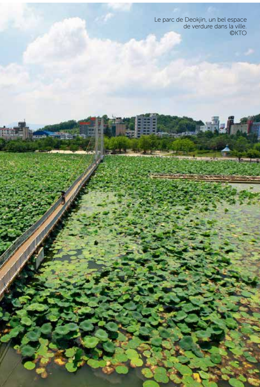
Le parc de Deokjin, un bel espace de verdure dans la ville.

Quittons-nous sur cette image spirituelle de la fleur de lotus. Ma description de la ville de Jeonju vous a-t-elle mis l'eau à la bouche ? Si c'est le cas, il ne vous reste plus qu'à choisir votre moyen de transport pour vous y rendre. Plusieurs options s'offrent en effet à vous : le KTX, train à grande vitesse, vous emmènera en deux heures de Séoul jusqu'à destination ; le bus express vous déposera à la gare routière dans le centre-ville en deux heures et demie ; des bus limousine au départ de l'aéroport d'Incheon circulent aussi toutes les trente minutes et vous amènent en trois heures et demie près de la mairie de Jeonju. Et si vous êtes très courageux, pensez au vélo !