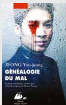
GÉNÉALOGIE DU MAL de JEONG You-jeong

Traduit du coréen par Choi Kyungran et Pierre Bisiou