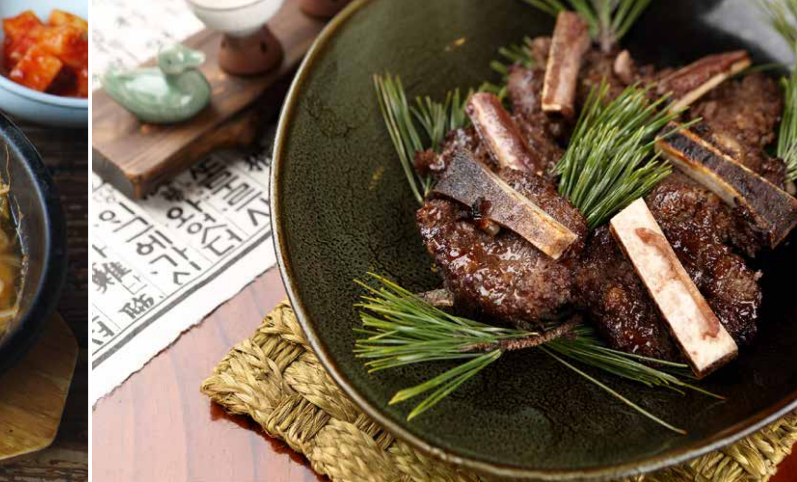
Le tteokgalbi de Jeonju, qui donne vraiment envie de se mettre à table.