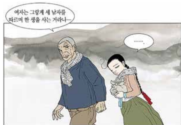
Le sexagénaire Kim Dong-hwa, grand maître de la bande dessinée traditionnelle coréenne a, lui aussi, franchi le pas vers le webtoon avec « Fleur de pommier ». © Kim Dong-hwa

Sur le marché francophone, la plateforme Delitoon, associée à Daou Technology depuis 2015, diffuse des séries en français en provenance de Corée, de Chine et parfois de France. Comme beaucoup, elle propose les premiers épisodes de chaque série gratuitement avant d'utiliser un système de crédits pour donner accès à la suite des aventures. Sa page Facebook est déjà suivie par plus de 45 000 fans. À titre de comparaison, celle du Journal de Spirou n'en comporte que 30 000.