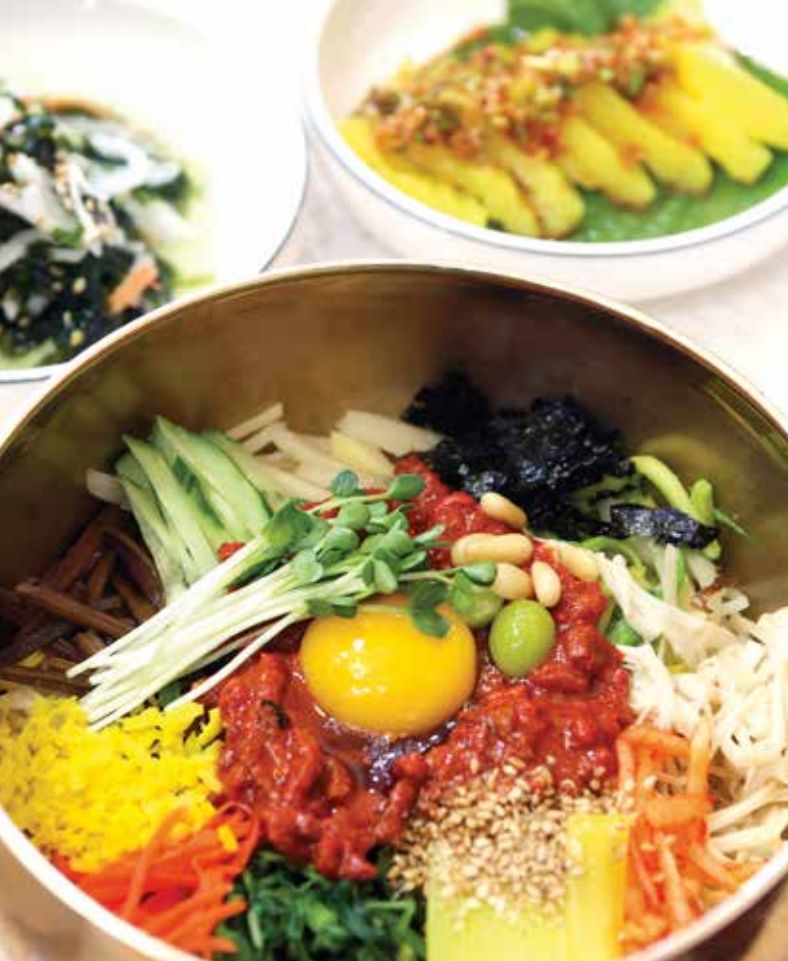
Le fameux bibimbap de Jeonju.