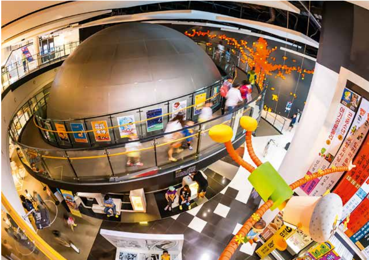
Le Musée de la bande dessinée coréenne de Bucheon, là où un siècle de manhwa et de webtoon se contemple.