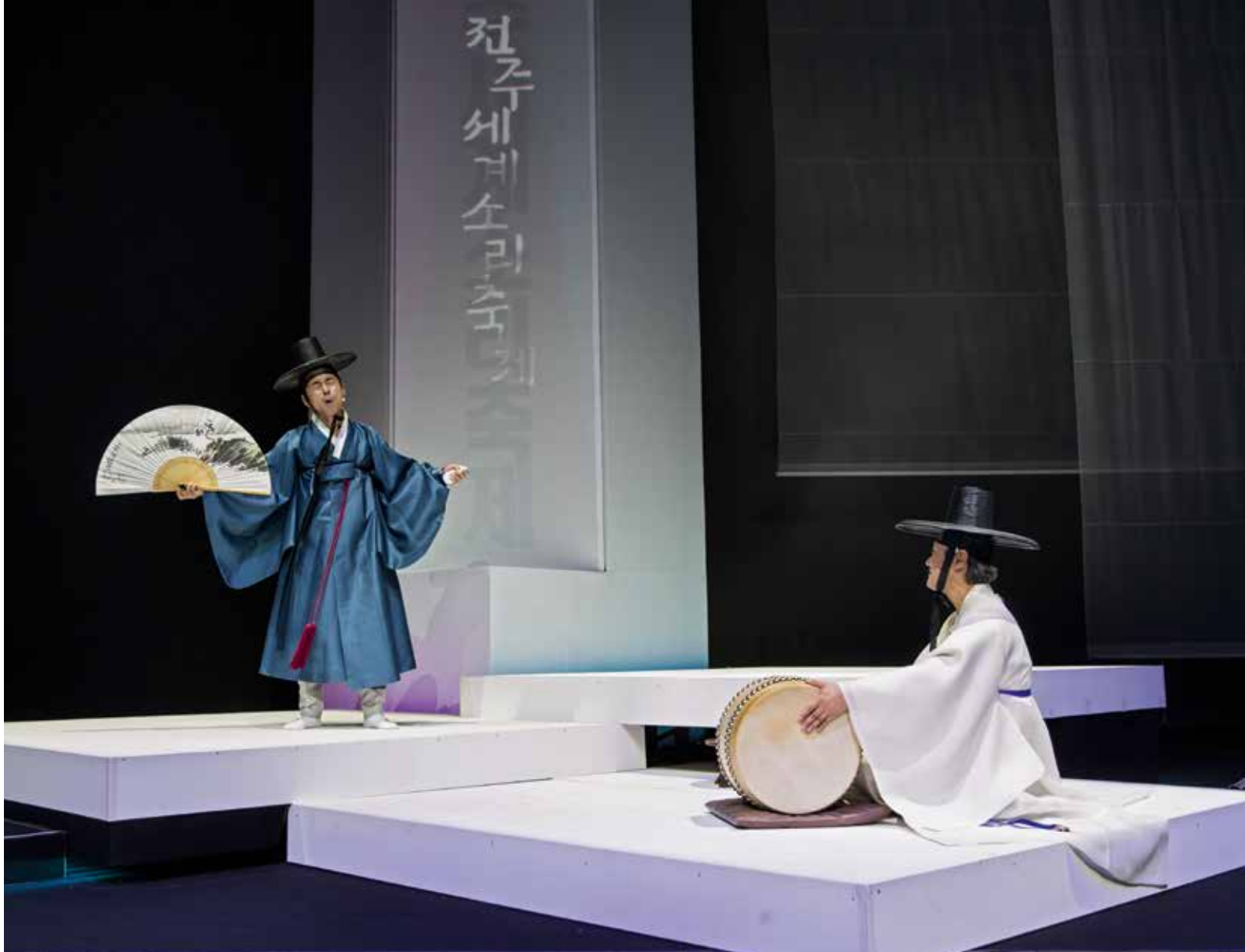
Un grand moment du festival 2017 : le maître Yoon Jin-chul interprète Le dit de la Falaise Rouge , l'un des cinq pansoris classiques.

programmés, puisque, par exemple, At Adau de Malaisie mêle les sons de Bornéo à ceux du rock, que les Tiempos Nuevos espagnols bien nommés revisitent la tradition flamenca « sans frontières ni clichés », ou que l' Oscuro quintet américain plonge le tango dans le jazz et le classique. Pour s'en tenir au groupe français qui a marqué les esprits, La Tit' Fanfare , comme le revendique leur site, « mélange des influences orientales, indiennes, des sons d'Afrique, d'Europe de l'Est et d'Amérique latine... il crée des mélodies épicées qui tourbillonnent d'un horizon à l'autre... aux rythmes des métissages sonores et culturels... » Ainsi, la rencontre n'est pas une simple juxtaposition de cultures, mais s'inscrit dans une dynamique des recherches de chacun, où chacun se révèle en révélant l'autre, comme, ici, la rencontre qui eut lieu entre La Tit' Fanfare et l'une des gloires montantes coréennes, Yu Taepyeongyang , présenté par la KBS comme « le jeune leader de la prochaine génération de chanteurs de pansori. »