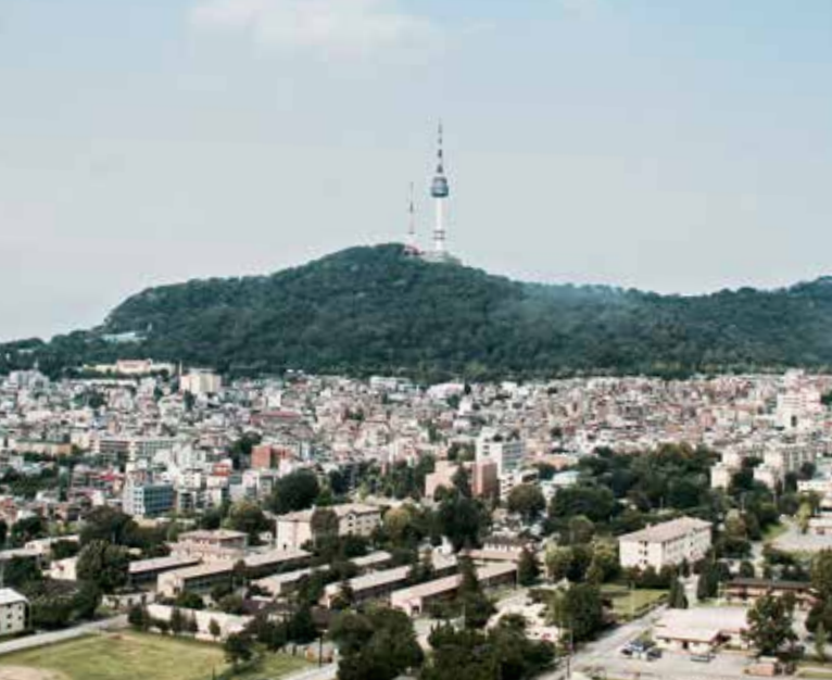
▲ Le Mont Namsan et sa fameuse Seoul Tower.