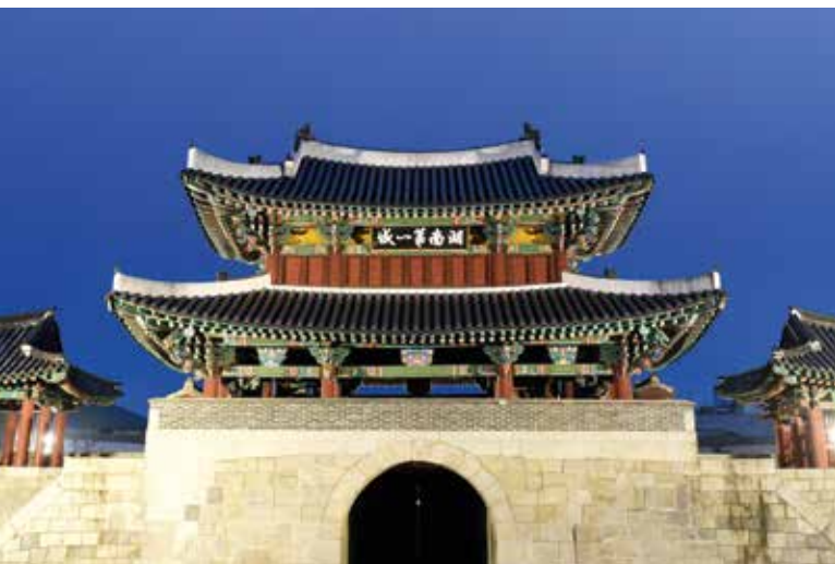
Pungnammun, la Porte du Sud de Jeonju, trésor national coréen.