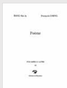
« POÈME » Avec François CHENG et BANG Hai Ja

Il s'agit là du 1 er livre d'artiste réalisé par Bang Hai Ja édité par les Éditions d'art de la galerie du Bourdaric. En réunissant ainsi François Cheng et Bang Hai Ja autour d'un poème choisi par l'artiste, l'éditeur a souhaité synthétiser de la plus belle des manières cette rencontre d'âmes exceptionnelle. L'intervention directe de l'artiste dans le livre, dont chaque exemplaire comporte deux œuvres originales réalisées sur papier coréen, rend chaque exemplaire unique ; tous sont numérotés (de 1 à 30) et accompagnés des signatures de l'artiste et du poète.