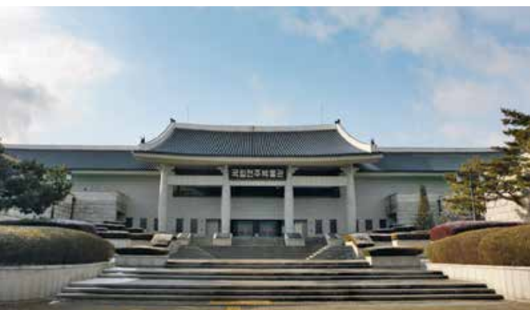
▲ Le Musée National de Jeonju.

J'ai gardé le meilleur pour la « fin »... ou plutôt pour la « faim » ! Jeonju est considérée par les Coréens comme la capitale gastronomique du pays. Véritable destination culinaire et paradis gourmand, la ville a même été classée « Cité de la gastronomie » par l'UNESCO. « Mangez une fois à Jeonju, vous ne l'oublierez jamais ! » c'est ce que disent les Coréens. Cette province verdoyante est aussi une région agricole fertile, ce qui explique la grande variété et l'abondance de produits et plats locaux.