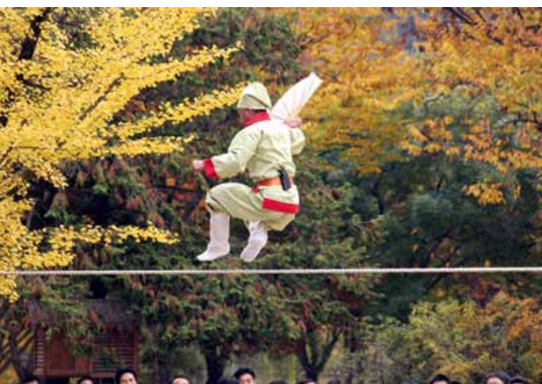
Jultagi, spectacle acrobatique traditionnel.

Si vous préférez l'automne et son feuillage éblouissant, l'autre grand festival à ne pas manquer est le Jeonju International Sori Festival, principal évènement musical en Corée consacré aux traditions musicales anciennes et aux musiques du monde. Depuis sa création, le festival est le rendez-vous de tous les grands noms de musiques traditionnelles coréennes et bien sûr celui du Pansori, art vocal et de scène emblématique de la Corée qui est depuis quelques années inscrit au patrimoine immatériel de l'humanité de l'UNESCO. Fondé en 2001, ce festival a connu un succès grandissant qui a conduit depuis 2011 à une ouverture sur le monde et une rencontre avec des talents internationaux.