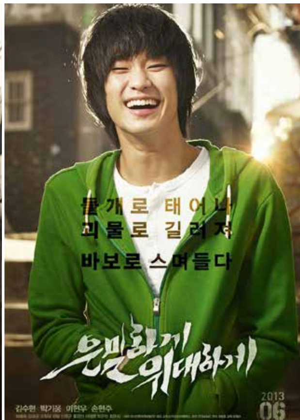
Choi Jong-hun, dit Hun, est l'auteur de plusieurs webtoons à succès dont « Secretly Greatly », qui a atteint un record au box-office coréen pour son adaptation au cinéma avec dans le rôle principal le jeune acteur Kim Soo-hyun (photo ci-dessus).

de l'aventure. Enfin, certaines séries comprennent de petites animations à l'intérieur des cases, voire des sonorisations qui accompagnent l'émotion, mélodie légère pour les comédies romantiques, bruits stridents au plus fort de la tension pour un thriller angoissant. Le webtoon avec son défilement vertical impose une nouvelle grammaire du récit en bande dessinée ; cependant l'essentiel du principe de lecture est préservé, c'est au lecteur d'imaginer le récit qui se déroule d'une case à l'autre.