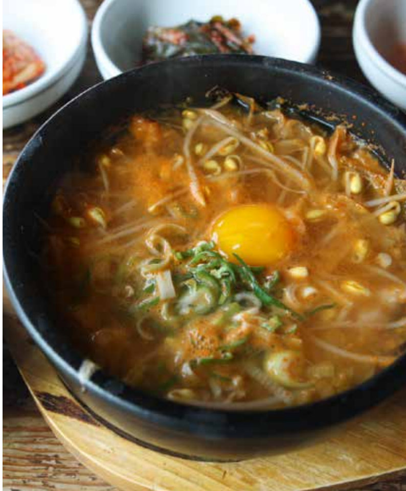
Kongnamul gukbap , la célèbre soupe de pousses de soja au riz.

de saveurs, un mandara comestible. Jamais, on va le voir, en Corée, le spirituel et le cosmique ne quittent la table sans avoir dit leur mot. Le bibimbap est l'emblème de Jeonju avec le hanji (한지), le papier des artistes et des paravents, le papier de l'édition originale de « Stèles » (Victor Ségalen, 1912). Le bibimbap est une potion magique, une farandole de nuances, servie coiffée de gochujang , la sauce de piment, d'un œuf miroir, d'un tartare de bœuf et d'algues sèches en paillettes. Beau, goûteux et excellent pour la santé.