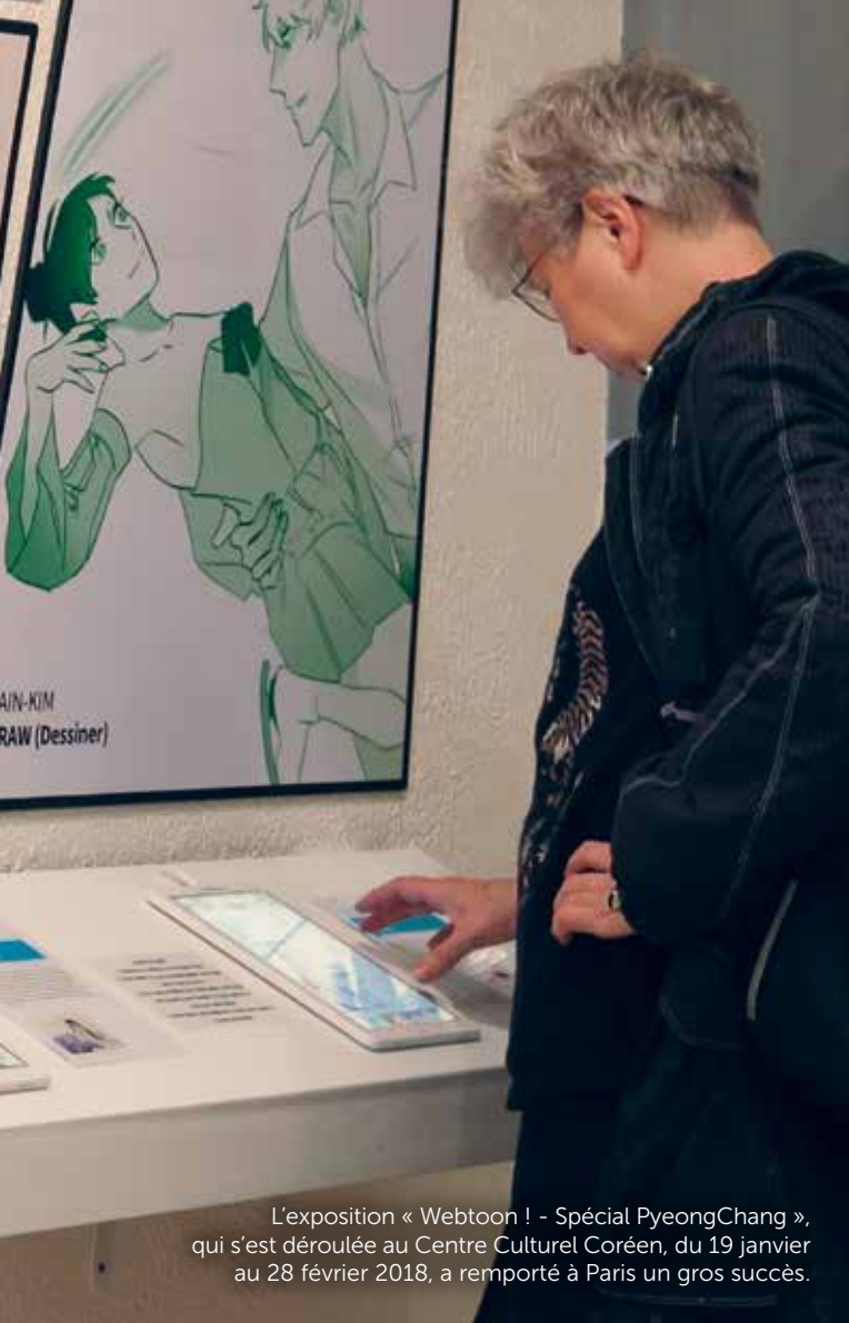
L'exposition « Webtoon ! - Spécial PyeongChang », qui s'est déroulée au Centre Culturel Coréen, du 19 janvier au 28 février 2018, a remporté à Paris un gros succès.

impliquant textes et images. Au 20 e siècle, pendant l'occupation japonaise et depuis la fin de la seconde guerre mondiale, les manhwa se développent aussi bien au Nord qu'au Sud. Jouissant d'une grande popularité, ils évoluent au rythme du pays. Les petits fascicules des années 1950 cèdent peu à peu la place à des magazines en petit format ou des volumes destinés à la location. Puis, dès les années 1970, d'épais magazines hebdomadaires destinés à la jeunesse font les beaux jours des kiosques coréens. Au sommaire, des feuilletons par dizaines tiennent en haleine un lectorat avide d'évasion. La crise asiatique de la fin des années 1990 atteint rudement les sociétés de presse et ces magazines ferment les uns après les autres, laissant des lecteurs et auteurs orphelins.