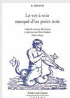
LE VER À SOIE MARQUÉ D'UN POINT NOIR de RA Hee-duk