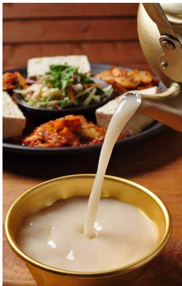
Le très réputé makgeolli de Jeonju.

On peut fourrer le kimchi de jeotgal , lorsque l'imagination règne en cuisine. Donc, faites-la jouer pour offrir à vos hôtes une table princière, les dix saveurs de Jeonju et leurs myriades de nuances. Quatre sortes de kimchi , minimum, du crabe cru, de la soupe, des radis, des épinards, du poisson, de la viande cuite, de la bourse-à-berger qui soigne les calculs... Voici une suggestion : placez donc au centre de la table un plat de tteokgalbi , de galettes de côtes de bœuf. La viande hachée marine avec alcool de riz, miel, sucre, sauce de soja... Ensuite, la galette embrasse l'os avec les épices avant d'être rôtie. Servez avec « le » makgeolli de Jeonju. On peut aussi le déguster de bar en bar dans le Jeonju Makgeolli Town. Dangereux ? Jamais de la vie si vous concluez par une kongnamul gukbap , la soupe de pousses de soja au riz, la providence des fêtards patraques et des estomacs blessés, avec hareng séché, anchois... C'est la fameuse soupe de minuit ou la soupe de l'aube selon les appétits, les aventures au gré de la capitale gastronomique dont la dynastie Yi fit son berceau. Choix judicieux. On peut donc être roi et avoir un palais avisé !