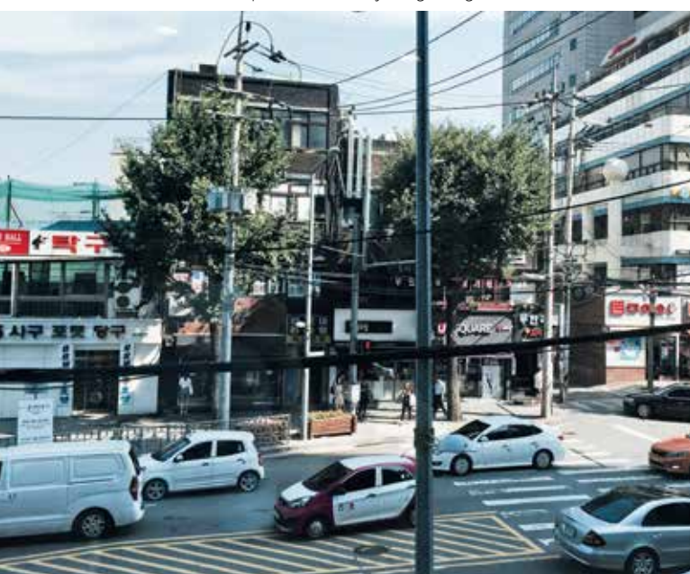
▼ Séoul, quartier de Namyong-dong.

ne l'attend pas, elle peut paraître un peu « bourrue » au premier abord, mais elle est pleine de force et elle vous aidera volontiers dans votre ascension... à condition que vous fassiez l'effort de monter les premières marches tout seul(e). Elle ne vous mènera pas jusqu'à la sortie du métro, mais vous aurez passé l'étape la plus compliquée. Encore quelques pas et vous sentirez la chaleur étouffante de Séoul vous avaler.