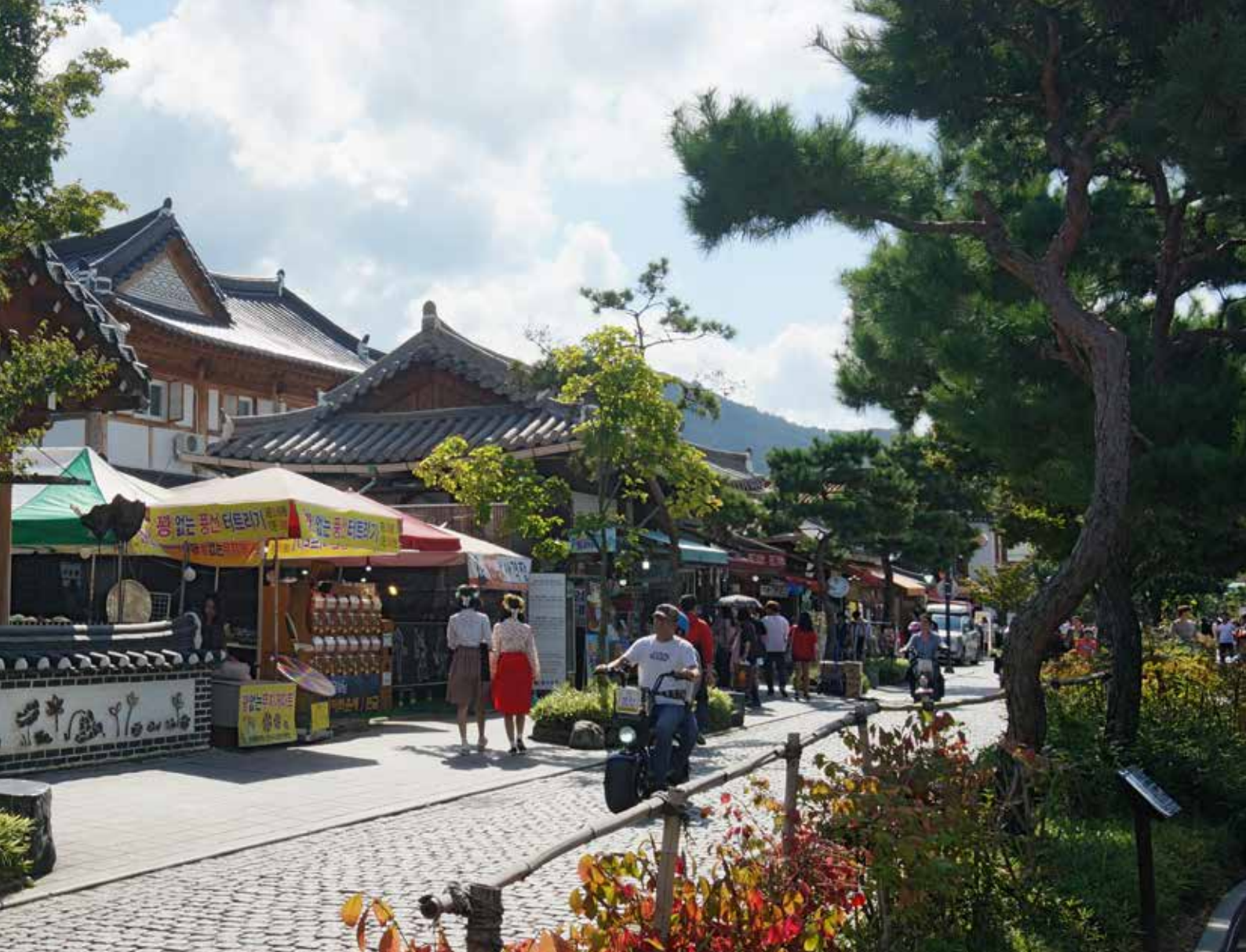
Rue commerçante du village traditionnel Hanok Maeul.

Une petite promenade à pied au cœur de ce village vous fera voyager dans le temps et découvrir le style de vie de l'époque. Avec un peu de chance, vous pourrez également assister à des spectacles traditionnels en tous genres et en particulier au Jultagi , spectacle acrobatique sur une corde suspendue réalisé par de remarquables funambules. Je vous suggère aussi de vous arrêter un instant sur la colline située au centre de ce village offrant une vue imprenable sur les toits avec en arrière-plan les édifices de la ville moderne.