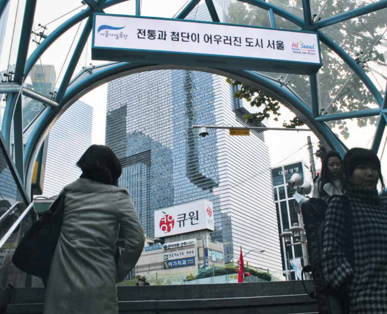
Sortie de la station de métro Gangnam, donnant sur le quartier d'affaires du même nom.

tables faute d'autre occupation, un client arrive, on prend sa commande et on le sert en moins de quatre minutes. Dans le restaurant d'à côté, le kimchi jjigae bouillant est servi à table, on se jette dessus, on se brûle la langue, les yeux pleurent, le piment pique la gorge, mais cela fait du bien, cela rappelle que l'on est vivant, on aime ça. On mange avec appétit et on le montre - quitte à choquer les touristes européens en faisant « beaucoup de bruit en mangeant ». On fait attention à bien terminer son bol de riz, c'est lui le plat principal, le reste est un accompagnement. Le repas fini, on ne traîne pas à table, on pose ses baguettes et/ou sa longue cuillère en métal, on se lève pour payer l'addition à la caisse et on repart vaquer à ses activités. On reprend le métro et on en profite pour se plonger dans les informations du jour ou pour regarder l'épisode du drama de la veille, car même à 40 mètres sous le sol, recouvert par des couches de terre et d'acier, la connexion internet est meilleure que celle que vous aurez en pleine rue à Paris. Même internet va « palli, palli » en Corée du Sud. Puis, on émerge rapidement de la bouche de métro, on adopte le bon rythme de