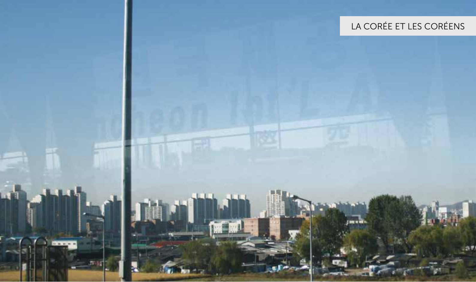
Paysages urbains sur le trajet de l'aéroport d'Incheon vers Séoul.