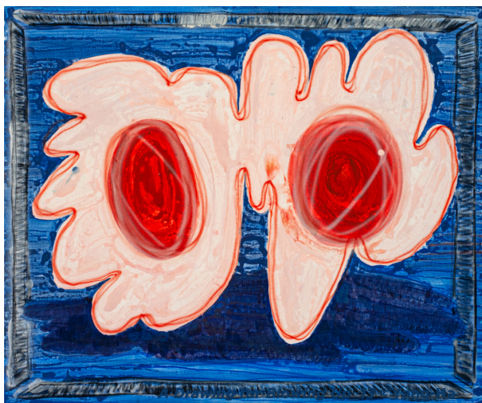
A Drawing for Blowing Up_21 ©Yang-ha

Yang-ha travaille sur la reconstruction d'images sur supports plats, en intégrant des éléments contradictoires issues de l'histoire et de la religion. La tragédie entre les récits macros et les narrations personnelles est visualisée à l'aide d'éléments métaphoriques enfantins et maladroits.