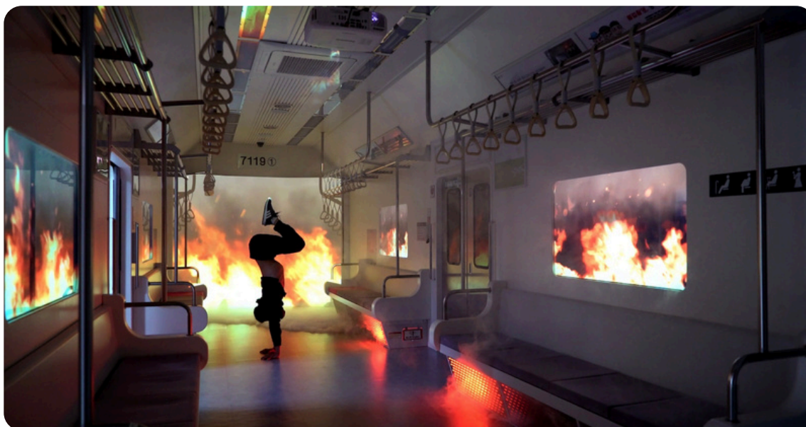
Simulation #1-4