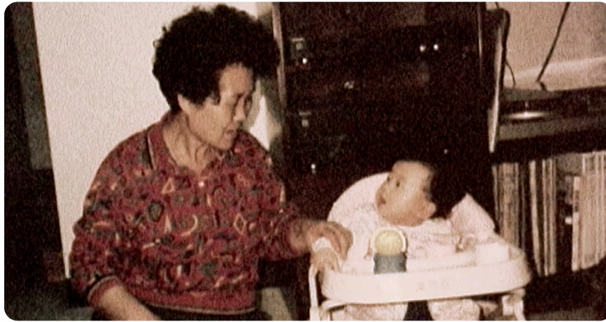
The Way We Wait ©JiYoon Park

JiYoon Park est une artiste cinéaste qui réalise des films de non-fiction créatifs. Ses films laissent place aux ambiguïtés et explorent des langages visuels uniques. Elle capture des moments surréalistes et peu familiers de notre vie quotidienne et les recontextualise pour suggérer des façons non conventionnelles de voir le monde.