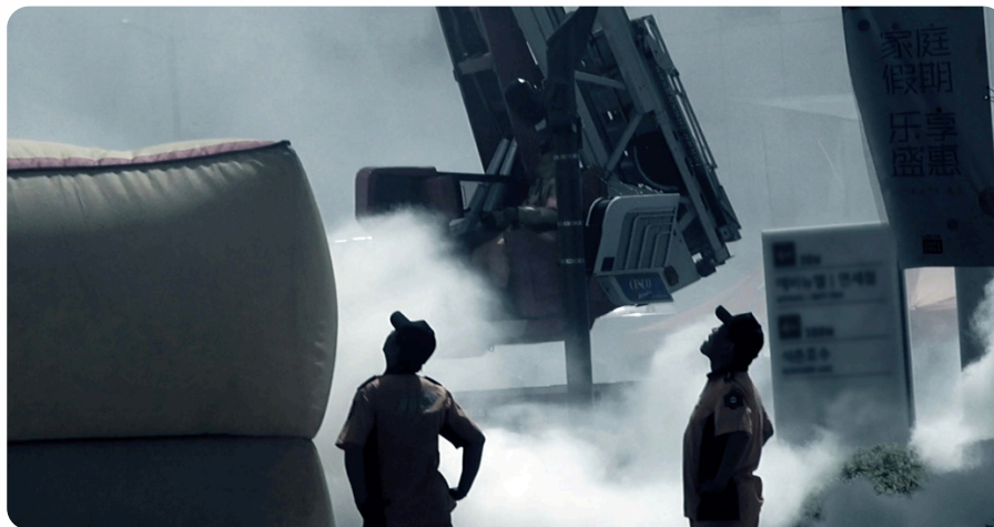
Future Practice © Shin Jungkyun

Elle a été diplômée d'une licence d'Histoire de l'art et de Cinéma & Télévision à l'Université pour femmes Ewha et a effectué un master à l'Université d'Édimbourg où elle a étudié la réalisation de films. Ses œuvres ont été choisies et diffusées dans le monde entier sur des chaînes vidéos telles que NOWNESS, et dans de nombreux festivals de films sélectionnés pour les Oscars et BAFTA, notamment AFI Docs, IDFA, Ji.hlava IDFF et Open City Documentary Festival.